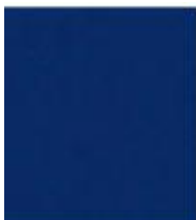
Aurora modra MC (34J)