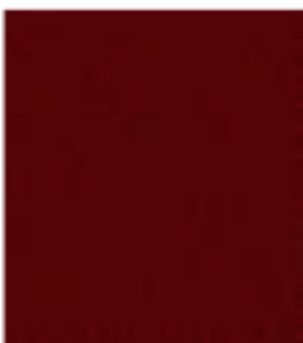
Copper rdeča MC (32V)